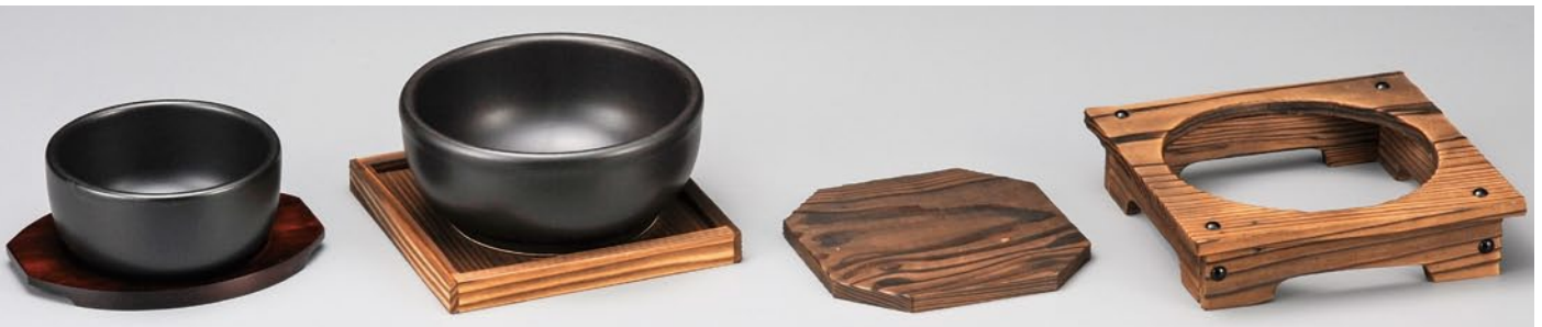
49412-489 黒ビビンバ(ミニ) 1,500円 (137×67mm)