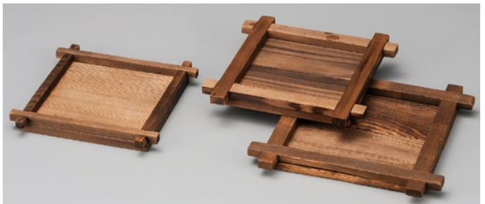
49421-469 焼杉井桁なべしき(細) 1,260円 (180×180×20mm)