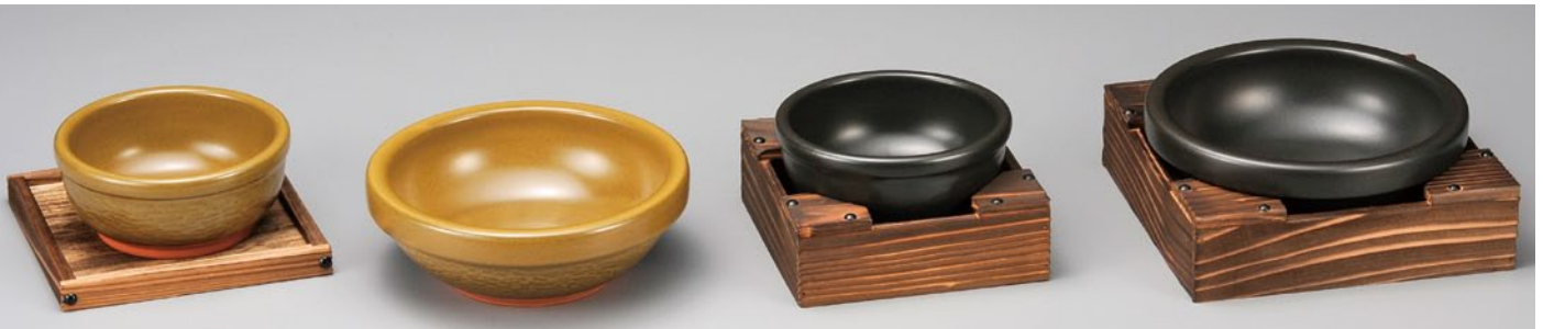
49401-359 ビビンバ鍋(茶)(小) 1,700円 (150×65mm)