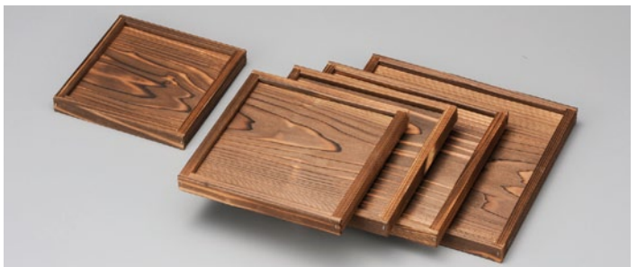
49429-489 16cm枠付敷台 820円 (160×160×20mm)