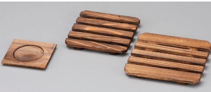
49418-489 13cmイカダスノコ 400円 (130×130×15mm)