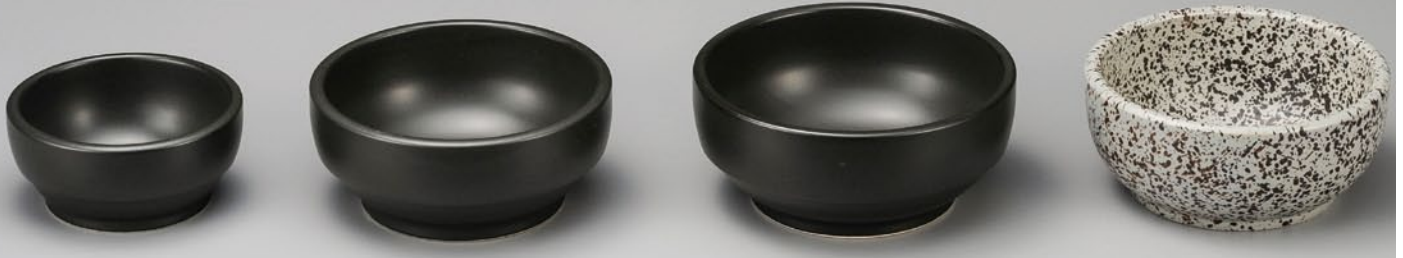
49408-189 超耐熱スタッキングビビンバ14cm(黒) 1,650円 (140×65mm)