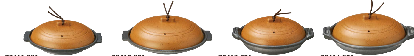
70411-331 陶土16cm丸陶板浅 (M11-301) 5,200円 (16.8×7cm) 70412-331 陶土18cm丸陶板浅 (M11-556) 6,300円 (19.5×7.5cm) 70413-331 陶土庵16cm深陶板 (M10-574) 6,150円 (16.8×7cm) 70414-331 陶土庵18cm深陶板 (M10-576) 6,850円 (19.5×7cm)