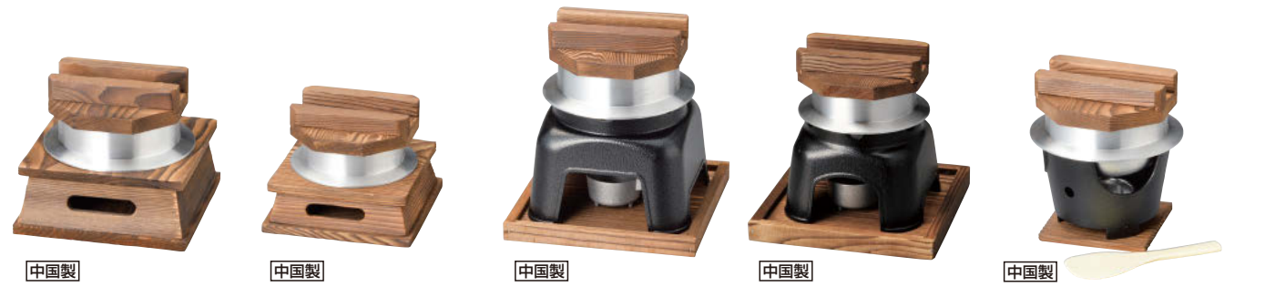
70401-331 釜めしセット焼杉台(大) 約1合(M10-219) 13,200円 (17.5×17.5×14.5cm) 70402-331 釜めしセット焼杉台(小) 約0.5合(M10-222) 11,050円 (15×15×11.5cm) 70403-331 お釜かまどセット(大) 黒(1合)(M10-230) 15,000円 (20.5×20.5×20.5cm) 70404-331 お釜かまどセット(小) 黒(0.5合)(M10-229) 13,800円 (18×18×17.5cm) 70405-331 お釜黒丸こんろセット(中) (0.7合)(M10-209) 10,350円 (内寸11.5×5.5cm) 70406-331 樹脂製しゃもじ(M40-248) 350円