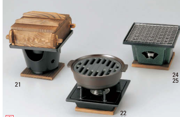
直 70821-841 角焼杉セイロコンロセット 7,750円 (17×17×19cm) 70822-841 新グリドル鍋 4,900円 (17×14.7×5.5cm) 70823-841 いろりコンロセット(小) 3,620円 (16×16×7.5cm) 70824-841 角コンロセット(緑いぶし) 4,260円 (14.5×13×8.5cm) 70825-841 焼物プレート焼網セット 4,910円 (16.5×16.5×1.2cm)