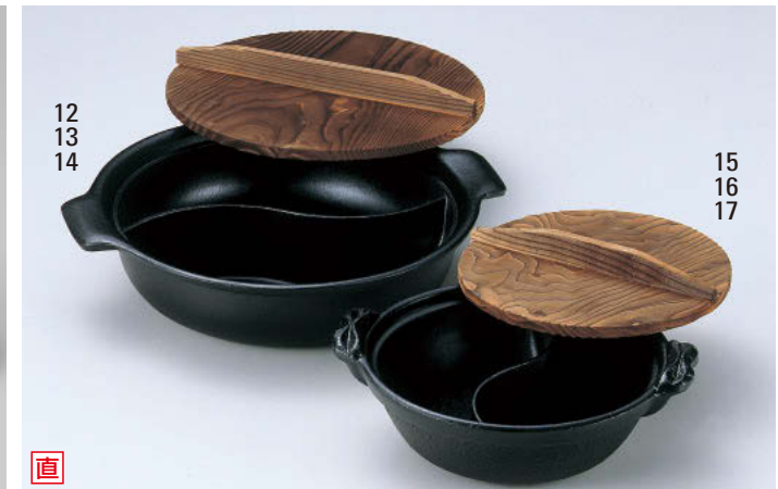
直 70912-841 源平鍋27cm 16,800円 (32×28×8.5cm) 70913-841 源平鍋30cm 19,400円 (34×30×9cm) 70914-841 源平鍋32cm 25,800円 (38×33×9cm) 70915-841 源平鍋18cm 5,810円 (22×18×6cm) 70916-841 源平鍋21cm 9,700円 (24.8×21×7.5cm) 70917-841 源平鍋24cm 13,700円 (29×25×8.5cm)