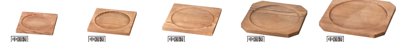
70528-331 段付13正角敷板(M40-476) 1,400円 (13×13cm) 70529-331 段付15正角敷板(M40-477) 1,700円 (15×15cm) 70530-331 段付18正角敷板(M40-478) 2,200円 (18×18cm) 70531-331 隅切段付21角敷板(M40-479) 3,250円 (21×21cm) 70532-331 隅切段付24角敷板(M40-480) 5,050円 (24×24cm)