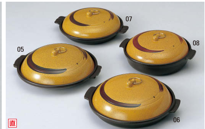
直 70905-841 陶板かすが浅型 4,900円 (21.5×19×7cm) 70906-841 陶板かすが深型 5,810円 (21.5×19×7.5cm) 70907-841 ミニ陶板かすが 4,520円 (20×16.5×6.5cm) 70908-841 ミニ陶板かすが深型 5,180円 (19×16.5×7.5cm)

陶板・土鍋 (信楽焼) 土鍋オープン (萬古焼) 土鍋 (萬古焼) 調理鍋 コンロ 柳川鍋 耐熱食器 セイロ ピンバ(耐熱) 敷板 レンジ 汁次・アラシ コンロ アルミステンレス 樹脂小物