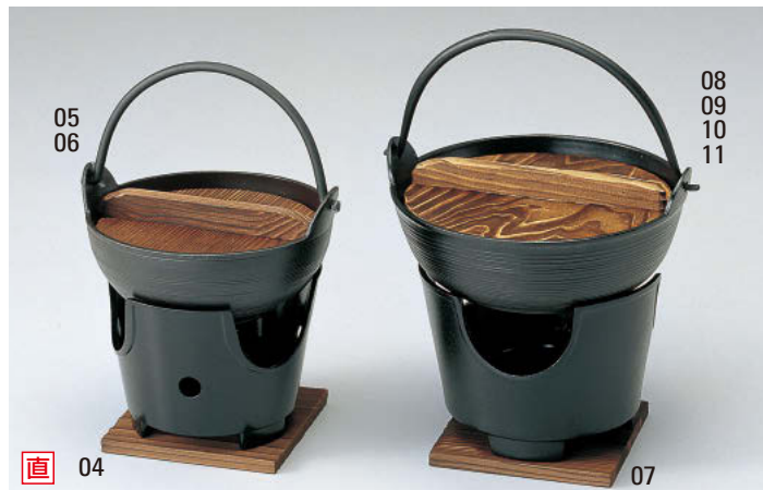
直 70804-841 コンロセット(小)黒 1,620円 (13.5×9.5cm) 70805-841 いろり鍋(フッ素加工)15 3,620円 (15×6cm) 70806-841 いろり鍋(フッ素加工)18 4,390円 (18×6.5cm) 70807-841 コンロセット(中)黒 3,230円 (14.5×10.5cm) 70808-841 いろり鍋(黒)15 3,230円 (15×6cm) 70809-841 いろり鍋(黒)18 4,000円 (18×6.5cm) 70810-841 いろり鍋(黒)21 6,200円 (21×8cm) 70811-841 いろり鍋(黒)24 8,260円 (24×8.5cm)