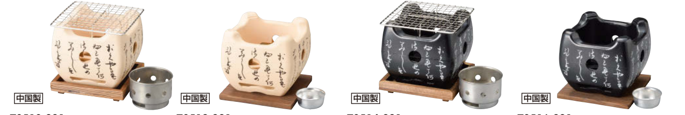
70510-331 いろはコンロ白(小)セット(M10-799) 炭入れ小・縁脚付板 15,250円 (12.2×12.2×10.5cm) 70512-331 いろはコンロ白(小)セット(M10-799) プレス火入れ・12角敷板付 9,000円 (12.2×12.2×10.5cm) 70514-331 いろはコンロ黒(小)セット(M10-804) 炭入れ小・縁脚付板 15,250円 (12.2×12.2×10.5cm) 70516-331 いろはコンロ黒(小)セット(M10-804) プレス火入れ・12角敷板付 9,000円 (12.2×12.2×10.5cm) 70511-331 いろはコンロ白(大)セット(M10-805) 炭入れ大・縁脚付板 25,800円 (15.2×15.2×13cm) 70513-331 いろはコンロ白(大)セット(M10-805) プレス火入れ・15角敷板付 15,000円 (15.2×15.2×13cm) 70515-331 いろはコンロ黒(大)セット(M10-806) 炭入れ大・縁脚付板 25,800円 (15.2×15.2×13cm) 70517-331 いろはコンロ黒(大)セット(M10-806) プレス火入れ・15角敷板付 15,000円 (15.2×15.2×13cm)