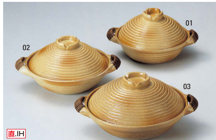
直.IH 70801-841 電磁用手造り楽鍋(新幸楽)24cm 44,840円 (31.5×26×16.5cm) 70802-841 電磁用手造り楽鍋(新幸楽)27cm 51,300円 (34.5×28.5×17cm) 70803-841 電磁用手造り楽鍋(新幸楽)30cm 54,520円 (38×31.5×19cm)

陶板・土鍋 (信楽焼) 土鍋オープン (萬古焼) 土鍋 (萬古焼) 調理鍋 コンロ 柳川鍋 耐熱食器 セイロ ピンバ(耐熱) 敷板 レンジ 汁次・アラシ コンロ アルミステンレス 樹脂小物