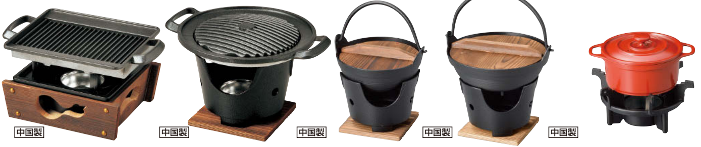
70415-331 さざ波角プレート1人用のみ (M10-549) 7,800円 (22×15×2.5cm) ※コンロ火入れは別売りです 70416-331 さざ波丸プレート1人用のみ (M10-577) 7,800円 (18×3cm) ※コンロ火入れ板は別売りです 70417-331 新ふるさと鍋(黒)15 (M10-002) 4,300円 (15×6cm) ※丸コンロ火入れ板は別売りです 70418-331 新ふるさと鍋(黒)18 (M10-004) 5,600円 (18×6.5cm) ※丸コンロ火入れ板は別売りです 70419-331 アルミニウムコック12cm赤(M11-079) 8,050円 (12×7.4cm) 70420-331 花梨コンロ(6本ツメ五徳)固形燃料専用(M11-317) 3,800円 (16×7.8cm) (火入れは入りません)