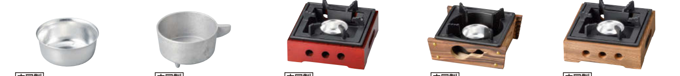
70501-331 火入れ(小)プレス・アルミ (M10-913) 280円 (5.5×2.5cm) 70502-331 火入れアルミ合金製 (M10-932) 600円 (5.5×3.5cm) 70503-331 民芸こんろブラウン(大) (M10-778)火入れ付 9,200円 (16.2×16.2×8.2cm) 70504-331 民芸コンロきわみ (M10-769)火入れ付 8,400円 (14.5×16.5×8cm) 70505-331 民芸風コンロ焼杉(大) (M10-777)火入れ付 8,300円 (16.2×16.2×8.5cm)