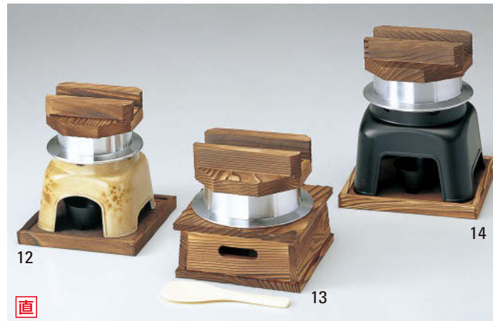
直 70812-841 ミニ釜飯カマド(幸楽)セット 7,750円 (16.5×16.5×18cm) 70813-841 ネズコ釜飯セット(飯杓子付) 6,500円 (16.5×16.5×15.5cm) 70814-841 釜飯カマド(セット) 7,650円 (19×19×21cm)

陶板・土鍋 (信楽焼) 土鍋オープン (萬古焼) 土鍋 (萬古焼) 調理鍋 コンロ 柳川鍋 耐熱食器 セイロ ピンバ(耐熱) 敷板 レンジ 汁次・アラシ コンロ アルミステンレス 樹脂小物