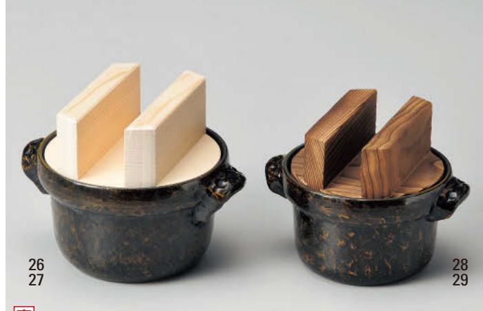
直 70826-841 3合炊ごはん鍋(黒アメ釉)フッ素・白木蓋 36,130円 (22×27.5×19cm) 70827-841 3合炊ごはん鍋(黒アメ釉)フッ素・焼杉木蓋 32,260円 (22×27.5×19cm) 70828-841 2合炊ごはん鍋(黒アメ釉)フッ素・白木蓋 22,000円 (19.5×24.5×18cm) 70829-841 2合炊ごはん鍋(黒アメ釉)フッ素・焼杉木蓋 20,700円 (19.5×24.5×18cm)