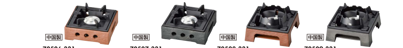
70506-331 PP製民芸コンロB-1茶 (M11-503)火入れ付 6,700円 (15.9×15.9×7.8cm) 70507-331 PP製民芸コンロB-1黒 (M11-504)火入れ付 6,700円 (15.9×15.9×7.8cm) 70508-331 PP製民芸コンロA-3茶 (M11-626)火入れ付 6,500円 (16.1×16.1×8.9cm) 70509-331 PP製民芸コンロA-3黒 (M11-627)火入れ付 6,500円 (16.1×16.1×8.9cm)