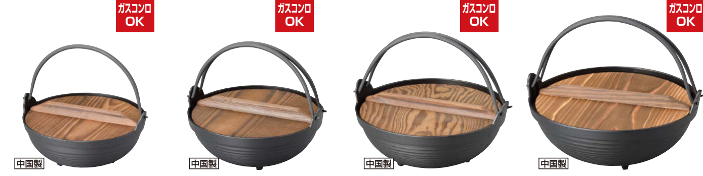
70421-331 新ふるさと鍋(黒)22(M10-259) 14,400円 (22×10.5cm)ガスコンロOK 70422-331 新ふるさと鍋(黒)24(M10-260) 21,200円 (24×11.5cm)ガスコンロOK 70423-331 新ふるさと鍋(黒)27(M10-261) 24,500円 (27×12.5cm)ガスコンロOK 70424-331 新ふるさと鍋(黒)30(M10-262) 30,000円 (30×13.5cm)ガスコンロOK