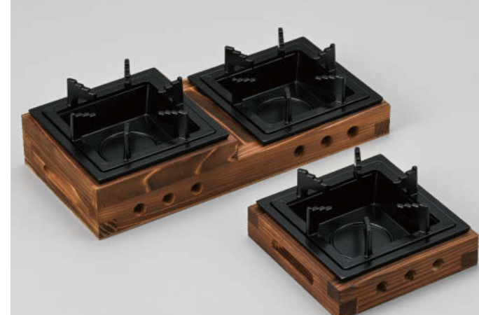
70918-841 二連二段民芸調コンロ 10,700円 (34×16.5×11cm)富山 70919-841 民芸調コンロ小 5,200円 (16.5×16.5×7cm)富山