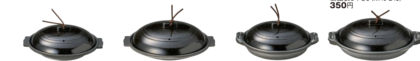
70407-331 金ちらし16cm丸陶板浅 (M11-726) 5,200円 (16.8×7cm) 70408-331 金ちらし18cm丸陶板浅 (M11-727) 6,300円 (19.5×7cm) 70409-331 金ちらし庵16cm深陶板 (M11-731) 6,150円 (16.8×7cm) 70410-331 金ちらし庵18cm深陶板 (M11-733) 6,850円 (19.5×7.5cm)