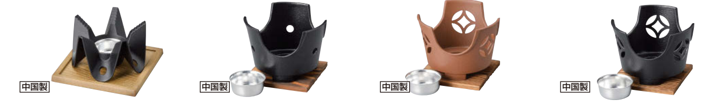
70518-331 さざ波コンロ(黒)(M11-449) PP製縁付15.5角敷板火入れ付 5,550円 (13.5×8cm) 70519-331 丸こんろ黒(大)(M10-782) 火入れ板付 2,800円 (13×9.5cm) 70520-331 丸こんろ七宝茶(大)(M10-796) 火入れ・敷板付 2,800円 (13×9.5cm) 70521-331 丸こんろ七宝黒(大)(M10-795) 火入れ・敷板付 2,800円 (13×9.5cm)