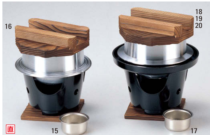
直 70815-841 浅釜(フッ素)コンロセット 5,450円 70816-841 浅釜(フッ素)木蓋付のみ 4,650円 70817-841 丸コンロ釜飯(フッ素)セット(フードリング付) 9,300円 70818-841 釜飯(1合)フッ素・木蓋付のみ 5,180円 70819-841 フードリングのみ 3,230円 70820-841 コンロセット(小)のみ 1,620円