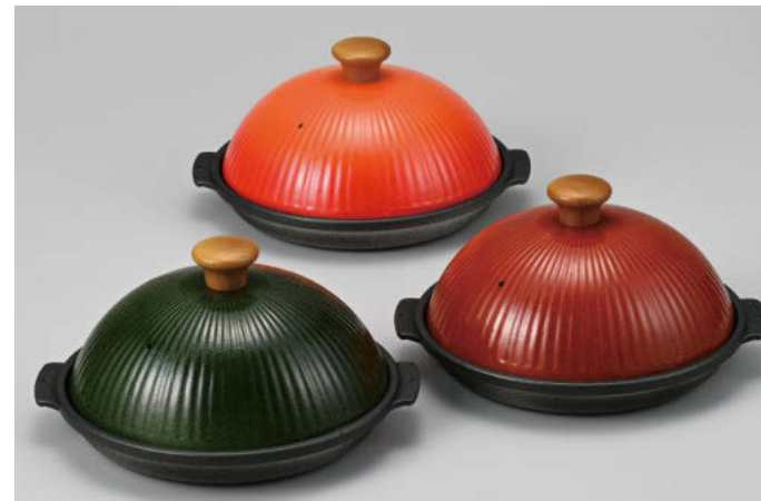
70909-841 ドーム型蒸鍋(京アメ)φ19 10,400円 (19×9cm・460cc)富山 70910-841 ドーム型蒸鍋(オリーブ)φ19 10,400円 (19×9cm・460cc)富山 70911-841 ドーム型蒸鍋(オレンジ)φ19 10,400円 (19×9cm・460cc)富山