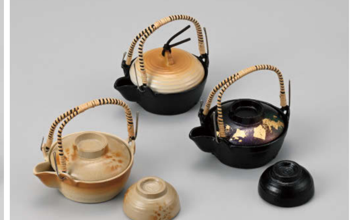
70920-841 宝楽片口鍋(宝楽)中 4,950円 (15.5×12.5×7.5cm・200cc)富山 70921-841 片口鍋(幸楽)アルミ千代口付中 7,500円 (15.5×12.5×7.5cm・200cc)富山 70922-841 片口鍋(七彩)千代口付中 9,100円 (15.5×12.5×7.5cm・200cc)富山